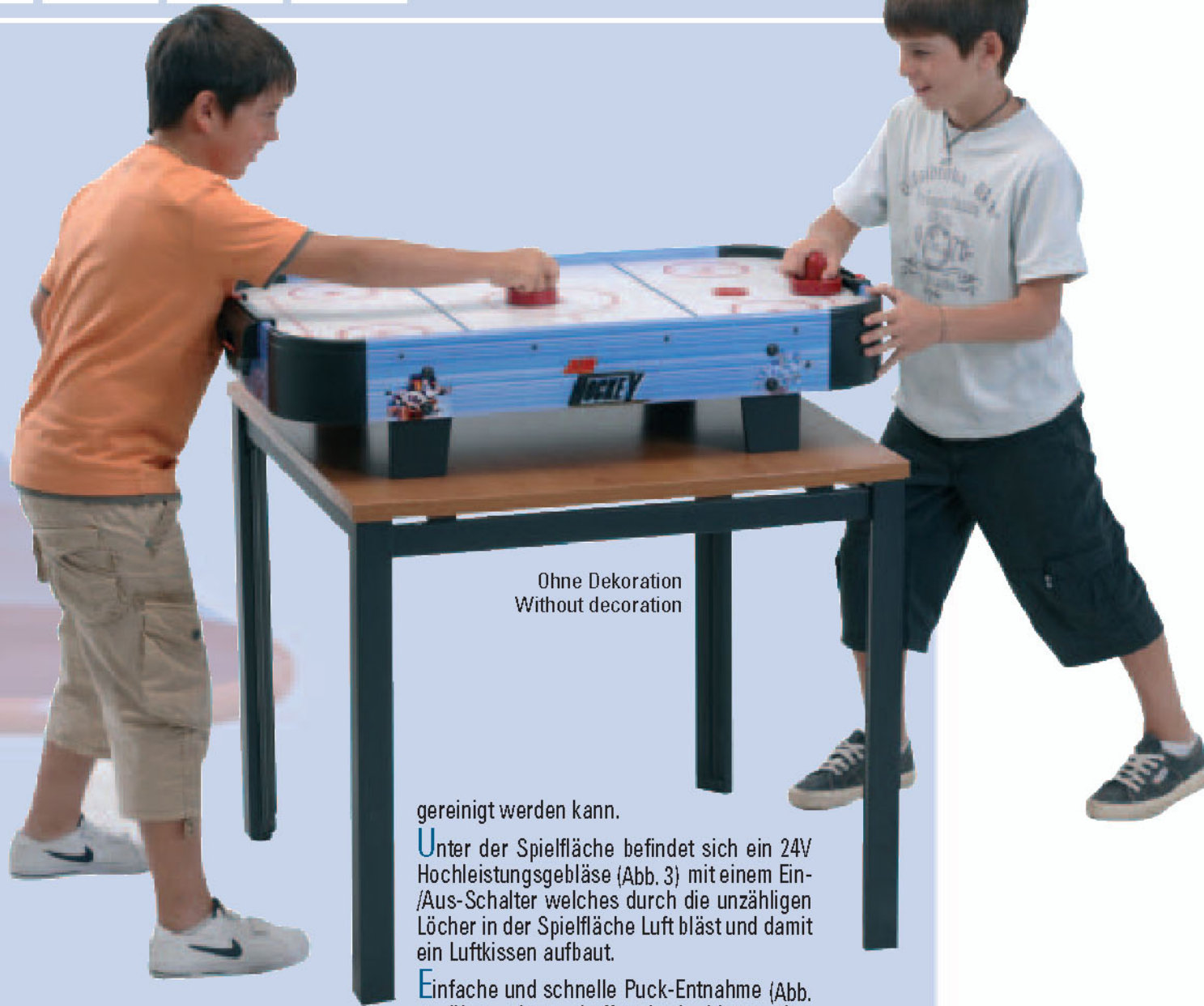
Ohne Dekoration Without decoration